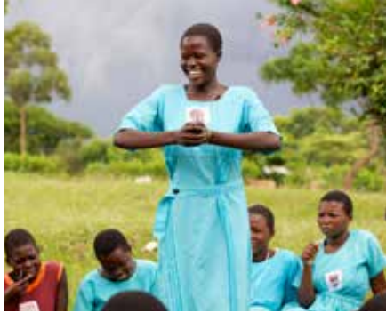
ប្រធានក្លឹបអនាម័យសាលារៀនដឹកនាំកិច្ចប្រជុំប្រចាំសប្តាហ៍នៅក្នុងភូមិ Eastern Uganda។

ខុសឆ្គង និងតំណាងពេលមករដូវ បង្ហាញអំពីរបៀបប្រើប្រាស់ កន្លែងអនាម័យប្រកបដោយប្រសិទ្ធភាព និងដាក់បញ្ចូលការគ្រប់គ្រងអនាម័យក្នុងពេលមានរដូវ ទៅក្នុងវគ្គផ្សព្វផ្សាយចំណេះដឹង អនាម័យដែលបានប្រព្រឹត្តទៅ នៅក្នុងអំឡុងពេលក្រោយការបំផុស។