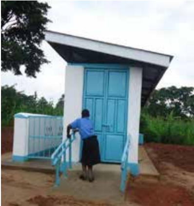
តំបន់បង្គន់អនាម័យ ដែលមានបង្គន់ប្រភេទ ជាក់លាក់ ព្រមទាំងមានបង្គន់ដៃ និងផ្លូវជម្រាម។

របាំងនានាដែលស្ត្រី និងកុមារីពិការជួបប្រទះ និង តម្រូវការខុសៗគ្នារបស់ពួកគេ គួរត្រូវបានពិចារណា ផងដែរ ទាក់ទងនឹងលក្ខណៈនៃការបង្កភាពងាយស្រួល និងភាពរួមបញ្ចូលនៅក្នុងព័ត៌មាន និងហេដ្ឋារចនា សម្ព័ន្ធសម្រាប់ការគ្រប់គ្រងអនាម័យក្នុងពេលមាន រដូវ។ ការធ្វើសវនកម្មលើការបង្កលក្ខណៈងាយស្រួល និងសុវត្ថិភាពរបស់មូលដ្ឋានផ្គត់ផ្គង់ទឹកស្អាត និង លើកកម្ពស់អនាម័យ ជាមួយក្រុមស្ត្រី និងបុរស កុមារី និងកុមារ រួមបញ្ចូលទាំងជនពិការគ្រប់ប្រភេទ គឺជា មធ្យោបាយដ៏ប្រសើរមួយក្នុងការបង្កើន ការយល់ដឹង ដល់អ្នកប្រតិបត្តិអំពីរបាំងនានា ទាក់ទងនឹងបច្ចេកទេស រចនា និងផលប៉ះពាល់របស់វាទៅលើអ្នកប្រើប្រាស់ មួយចំនួន (WEDC និងអង្គការWaterAidឆ្នាំ២០១៤)។ ការវិភាគរបាំងក្នុងការចូលរួមជាមួយ សមាជិកសហគមន៍ ជួយផ្តល់ចំណេះដឹងអំពីរបាំងដែលប្រជាជនជួបប្រទះ និងរៀបរយ ដែលសហគមន៍អាចដោះស្រាយបញ្ហាប្រឈមទាំងនោះ ( សូមមើល Frontiers of CLTS issue 3 ) ។ ចំណុចជាក់លាក់ដែលត្រូវការសម្រាប់សកម្មភាពគ្រប់គ្រងអនាម័យក្នុងពេល មានរដូវគួរ ត្រូវបានពិចារណា ដើម្បីធានាឱ្យមានការដាក់បញ្ចូលពិការភាពទៅក្នុងការពិចារណា អំពីសេចក្តី ត្រូវការក្នុងការគ្រប់គ្រងអនាម័យពេលមានរដូវ របស់អ្នកប្រើប្រាស់ជាស្ត្រី។ ប្រសិនបើមានការ ប្រើប្រាស់ប្រព័ន្ធផ្សព្វផ្សាយជារូបភាព ត្រូវធានាថារូបភាពទាំងនោះ ត្រូវបានរៀបរាប់ជាពាក្យសម្តី ផងដែរ ដើម្បីជួយបំពេញបន្ថែមសម្រាប់អ្នកដែលមានការលំបាកផ្នែកការមើល ហើយត្រូវមានការ បង្ហាញដោយរូបភាពដើម្បីជំនួយដល់អ្នកដែលមានការលំបាកក្នុងការស្តាប់។