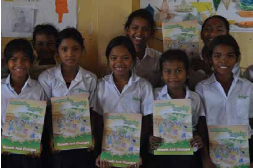
ប្រភពឯកសារ៖ Dr Marni Sommer, Columbia University. Photo: Girls in Cambodia with 'Growth and Changes' book. Credit: Susan Connolly/ Grow and Know

សៀវភៅមានខ្លឹមសារប្រកបដោយអត្ថន័យយ៉ាងរស់រវើក ស្តីពីភាពពេញវ័យ និងការគ្រប់គ្រង អនាម័យក្នុងពេលមានរដូវ រួមទាំងរឿងរ៉ាវស្តីពីពេលមាន រដូវដែលសរសេរ ដោយកុមារីវ័យ ជំទង់។ សៀវភៅនេះ ផ្តោតគោលដៅ ចំពោះកុមារីចន្លោះពីអាយុ ១០ ឆ្នាំ ដល់ ១៤ ឆ្នាំ។ អ្នកអាចទាញយកសៀវភៅនេះបានតាមរយៈ www.growandknow.org/books.html