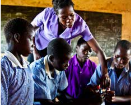
កុមារីជាសិស្សសាលាបឋមសិក្សា នៅក្នុងភូមិ Lira ភាគខាងជើងប្រទេស Uganda កំពុងរៀនពីអ្នកគ្រូរបស់ពួកគេអំពី MHM។