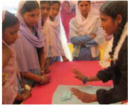
គ្រូបណ្តុះបណ្តាលបង្រៀនកុមារីអំពីការប្រើប្រាស់សំឡីអនាម័យដោយមានសុវត្ថិភាព នៅក្នុងអំឡុងពេល Great WASH Yatra ដែលជាយុទ្ធនាការផ្សព្វផ្សាយអំពីអនាម័យក្នុងពេលមានរដូវ ធ្វើដំណើរកាត់រដ្ឋចំនួន ៥ នៅទូទាំងប្រទេសឥណ្ឌារយៈពេលជាង ៥១ ថ្ងៃ។