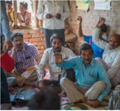
បុរសក្នុងសហគមន៍លេងល្បែងថាមពល ស្តីអំពីការផ្សព្វផ្សាយអនាម័យពេលមានរដូវ នៅ Ultra Pradesh ប្រទេសឥណ្ឌានៅខែមេសា ២០១៤។

ការមានបុគ្គលិកបុរសនៅក្នុងអង្គការ ដើម្បីធ្វើការដោយផ្ទាល់ជាមួយសកម្មភាព គ្រប់គ្រងអនាម័យក្នុងពេលមានរដូវ អាចជួយបំបែកបាំង និងតំណាម។ បុរសជាសមាជិក និងជាប្រធានសហគមន៍នឹងបានទទួលការលើកទឹកចិត្ត និងទទួលបានទិព្វលពីអ្នកសម្របសម្រួលជាបុរស ដែលអាចដើរតួជាចំណុចចាប់ផ្តើម សម្រាប់បញ្ហាផ្តោតលើយេនឌ័រជាក់លាក់មួយនេះ។ អ្នកសម្របសម្រួលជាបុរស អាចធ្វើឱ្យមានការចូលរួមពីបុគ្គលិករដ្ឋាភិបាល ដែលភាគច្រើនជាបុរសនៅឡើយនោះ ឱ្យពិចារណាអំពីការគ្រប់គ្រងអនាម័យក្នុងពេលមានរដូវនៅក្នុងគោលនយោបាយនិងសេវាសហគមន៍។ បុរសក្នុងសហគមន៍ អ្នកដឹកនាំបែបប្រពៃណី និងគ្រូបង្រៀន ក៏អាចក្លាយជាជំនួយសកម្មភាពគ្រប់គ្រងអនាម័យក្នុងពេលមានរដូវ ដ៏មានប្រសិទ្ធភាពផងដែរ។ អង្គការ Plan International ប្រចាំប្រទេសយូហ្គីនដា បានជំរុញឱ្យមានបុគ្គលិក