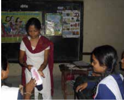
គ្រូបណ្តុះបណ្តាលកំពុងពន្យល់អំពីរបៀបប្រើប្រាស់សំឡីអនាម័យនៅក្នុងភូមិ Uttar Pradesh ប្រទេសឥណ្ឌា។