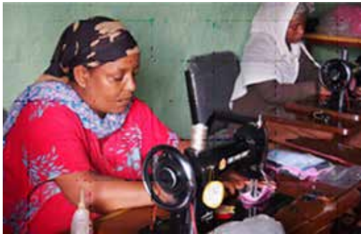
ស្ត្រីដេរកន្ទួបអនាម័យប្រភេទប្រើឡើងវិញបាននៅរោងជាងរបស់ ពួកគេ នៅវិទ្យាល័យ Dilela High School, Oromia, ប្រទេស អេធីអូភៀ ខែឧសភា ឆ្នាំ២០១៥។