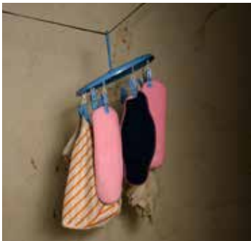
AFRipads ហាលនៅក្នុងផ្ទះមួយនៅភាគ ខាងកើតប្រទេសយូហ្គីនដា។

ក្នុងករណីស្ត្រីប្រើប្រាស់ផលិតផលអនាម័យ ប្រភេទ យកមកប្រើវិញបាន (លក់លើទីផ្សារ ឬរបស់កែច្នៃខ្លួនឯង) ដើម្បីស្រូបឈាមរដូវ នោះការបោកសម្អាតជាមួយសាប៊ូ និងទឹកស្អាត ព្រមទាំងមានទឹកនៃឯចំបារ (ហើយអាច មានឯកជនភាព) ដើម្បីហាលសម្ភារៈទាំងនេះ អាចជួយ ឱ្យសុខភាពអ្នកប្រើប្រាស់មានភាពប្រសើរឡើង។