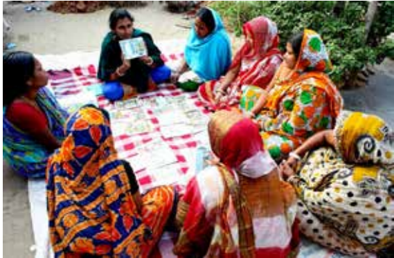
ស្ត្រីមកពីគណៈកម្មាធិការគ្រប់គ្រងជួបជាមួយសមាជិកសហគមន៍ ដើម្បីពិភាក្សាការអប់រំសុខភាព និងអនាម័យនៅភូមិ Kalshi Takar Baa Slum ទីក្រុង Dhaka ប្រទេសបង់ក្លាដេស ឆ្នាំ ២០១១។

នៅក្រោយពេលបំផុស គឺជា ឱកាសមួយដើម្បីពិភាក្សា អំពី ចំណេះដឹង ឥរិយាបថ និងការ អនុវត្តទាក់ទងជាមួយរដូវ និង អនាម័យក្នុងពេលមានរដូវនៅក្នុង សហគមន៍ និងដើម្បីរំលេចអំពី បញ្ហាប្រឈមដែលស្ត្រី និងកុមារី បានជួបប្រទះ នៅក្នុងបរិបទមួយ ជាក់លាក់។ កិច្ចពិភាក្សានេះអាច ធ្វើឡើងជាកិច្ច ពិគ្រោះយោបល់ សហគមន៍បែបបើកទូលាយ ឬជា ក្រុមចែកតាមភេទ។ ការចូលរួម របស់ កុមារ និងបុរសអាចជួយ កាត់បន្ថយ ការបង្ហាប់លេងសើច ដោយកុមារាមកលើកុមារី ហើយ អាចជួយឱ្យបុរសជាឪពុកមានការ គាំទ្របន្ថែមទៀតដល់កូនស្រី និងប្រពន្ធភាគី តាមរយៈ ការទទួលស្គាល់បញ្ហា ការបើកបង្ហាញអំពី ជំនឿខុសឆ្គង និងការមាក់ងាយ និងការផ្តល់ឱ្យនូវវេទិការសម្រាប់ការពិភាក្សា។