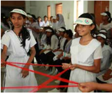
សិស្សស្រីនៅក្នុងប្រទេសបង់ក្លាដេសលេងល្បែងថាមពលក្នុងអំឡុងពេលវគ្គបណ្តុះបណ្តាលអំពីការគ្រប់គ្រងអនាម័យក្នុងពេលមានរដូវដែលបានរៀបចំដោយអង្គការសប្បុរសធម៌ WASH United ។