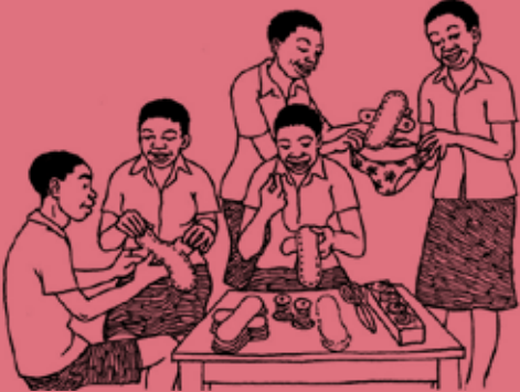
Illustration by Regina Faul-Doyle

ការមានរដូវគឺជាផ្នែកធម្មជាតិ និងសុខភាពនៃជីវិតសម្រាប់ស្ត្រី និងកុមារី ប៉ុន្តែជារឿយៗ វាជាប្រធានបទតំណមមួយ ដែលមិនងាយនឹងនិយាយដល់ ហើយអាចនាំអោយមាន អារម្មណ៍ខ្មាសអៀន និងអាម៉ាស់។ វាក៏អាចនាំអោយកុមារីបាត់បង់ ចំណាប់អារម្មណ៍ ទៅសាលា ឬមិនទៅសាលាប៉ុន្មានថ្ងៃ។ ការមានរដូវគឺជាធាតុយ៉ាងសំខាន់នៃអនាម័យ ដែលធានាឱ្យយល់ដឹងប្រជាជនពាក់កណ្តាលពិភពលោកទៅលើផ្នែកដ៏ធំនៃការរស់នៅ របស់ពួកគេ។ ក្នុងការបោះពុម្ពផ្សាយ ព្រំដែននៃកម្មវិធីសហគមន៍ដឹកនាំអនាម័យបង្ហាញ ពីវិធីសាស្ត្រដែលកម្មវិធីសហគមន៍ដឹកនាំ អនាម័យអាចពង្រីកបន្ថែមក្នុងការកំណត់ពីការ គ្រប់គ្រងអនាម័យពេលមានរដូវនៅសាលារៀន និងសហគមន៍ក្នុងការកាត់បន្ថយភាព ស្មុគស្មាញទាំងនេះសម្រាប់ស្ត្រី និងកុមារី។ សៀវភៅនេះបែងចែក ការរៀនសូត្រ អនុសាសន៍ ការ បង្កើតថ្មី និងបទពិសោធន៍ពីអង្គការ ផ្លែនអន្តរជាតិ (Plan International) អង្គការវត្តទេវតា (WaterAid) WSSCC, UNICEF, WASH United, Grow and Know, និង USAID/WASHplus.