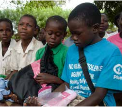
កុមារចូលរួមការបង្ហាញសកម្មភាពគ្រប់គ្រង អនាម័យក្នុងពេលមានរដូវ (MHM) នៅក្នុង ប្រទេសUganda ។